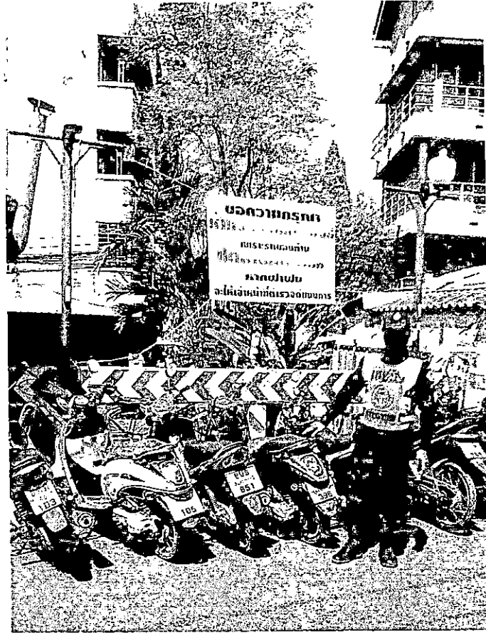
ภาพถ่ายรถจักรยานยนต์ของนักศึกษามหาวิทยาลัยเทคโนโลยีพระจอมเกล้าพระนครเหนือ ที่จอดบนถนนในซอยวงศ์สว่าง ๑๑